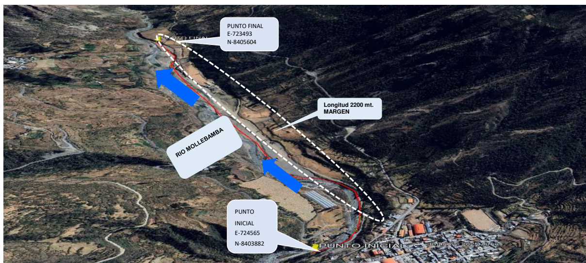
5.- IMAGEN SATELITAL DE ZONA VULNERABLE(GOOGLE EARTH)